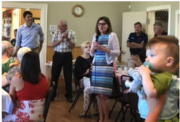
Des aînés de l'Île-du-Prince-Édouard au Congrès d'Halifax et de retour sur l'île

En 2018, le conseil de direction national de la CAL a adopté une nouvelle vision (citée plus haut) ainsi qu'un nouvel énoncé de mission : « Encourager les Canadiens plus âgés à participer aux affaires politiques de leur pays et aider le Parti libéral du Canada à connaître et à comprendre les intérêts et les besoins des aînés canadiens d'aujourd'hui et de demain. »